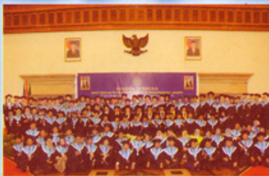
Wisuda Sarjana dan Diploma STIE Muhammadiyah Jakarta