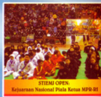
STIEMU OPEN Kejuaraan Nasional Piala Ketua MPR-RI