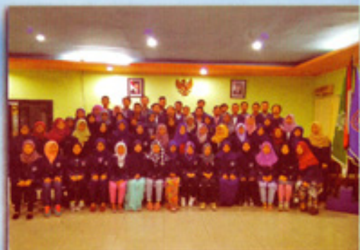
Mahasiswa Penerima Beasiswa BIDIKMISI