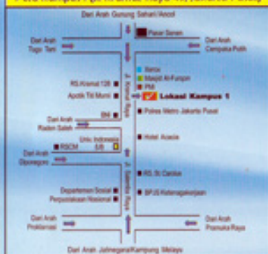
Peta Kampus I (Jl. Kramat Raya 49, Jakarta Pusat)