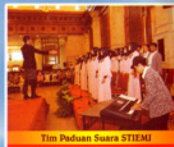
Tim Paduan Suara STIEMU

Info Jalur Kendaraan Kampus II : Metromini S-60 : Kampung Melayu - Manggarai Metromini S-62 : Pasar Minggu - Manggarai Kopaja S-66 : Blok M - Manggarai Kereta Api turun di Stasiun Manggarai Busway (Trans Jakarta)