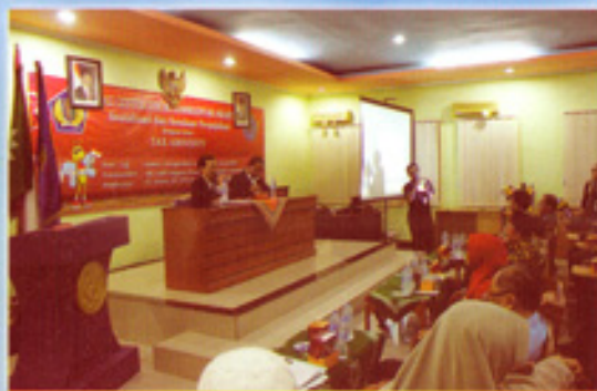
Sosialisasi dan Seminar Perpajakan