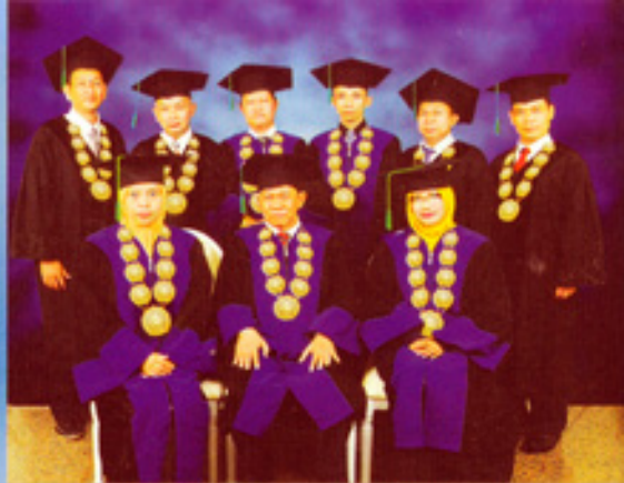
SENAT STIE Muhammadiyah Jakarta

Dengan ini mengajak adik-adik lulusan SMA/MA/SMK untuk bergabung bersama STIE Muhammadiyah Jakarta mewujudkan cita-cita menjadi lulusan yang profesional, berakhlak mulia, berpengetahuan dan percaya diri.